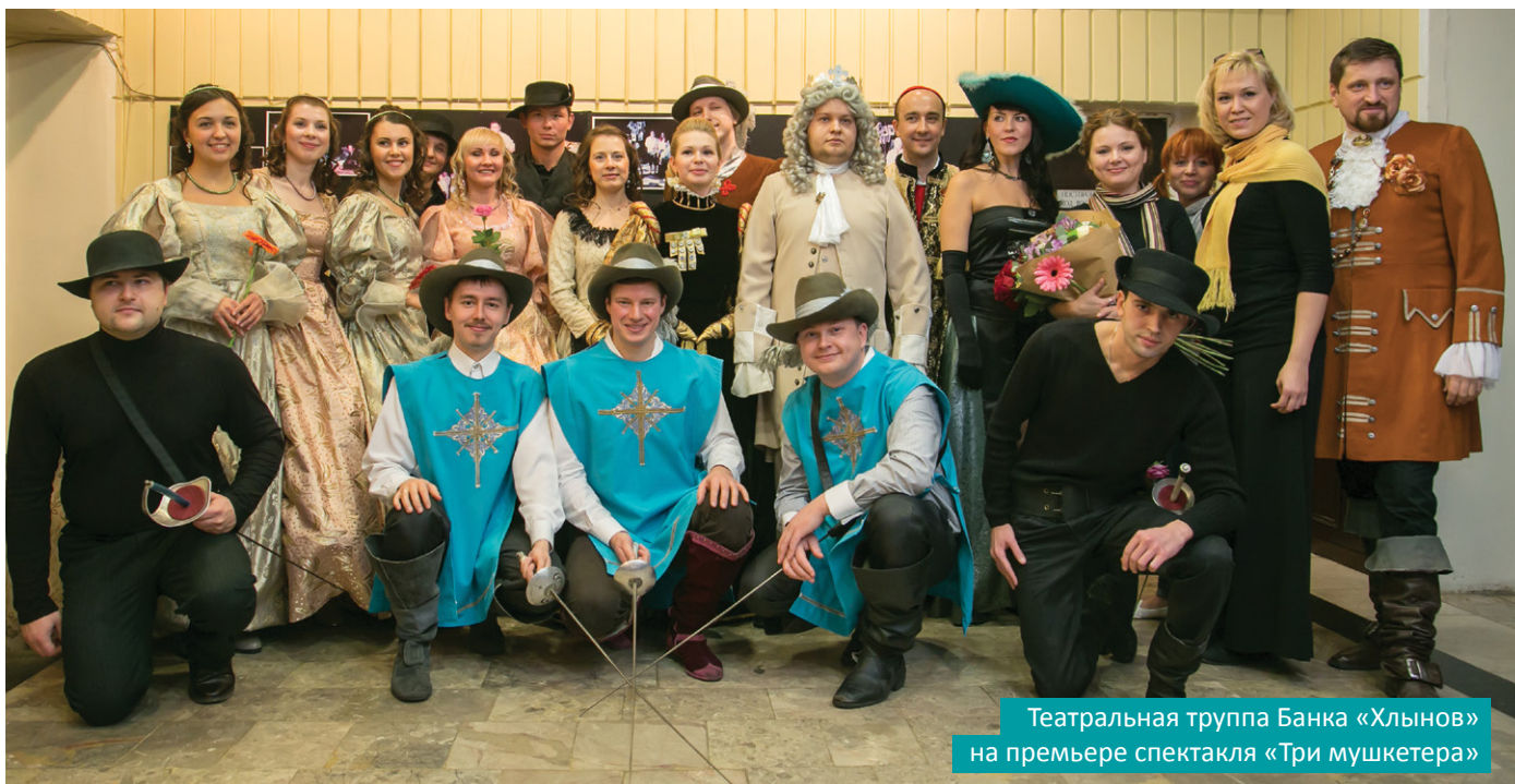
Театральная труппа Банка «Хлынов» на премьере спектакля «Три мушкетера»