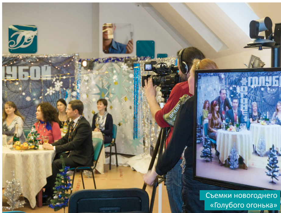
Съемки новогоднего «Голубого огонька»

Именно так, с головой погружаясь в атмосферу советских 1960-70-80-х, мы и встречаем Новый 2015 год!