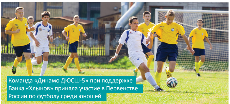
Команда «Динамо ДЮСШ-5» при поддержке Банка «Хлынов» приняла участие в Первенстве России по футболу среди юношей

— Я как гражданин или хозяйствующий субъект плачу налоги и тем самым пополняю бюджеты, обеспечивая, таким образом, исполнение государством, в том числе, своих социальных функций — выплату зарплат, пенсий, пособий. Я понимаю значимость уплаты мной налогов и делаю это ответственно, осознанно, в срок и в полном объеме. Однако если меня не устраивает текущее положение, то здесь у меня есть два пути: первый — возмущаться, пытаться таким образом «переделать систему». Это путь эмоциональный и неэффективный. Другой вариант: я, руководствуясь собственной свободной волей и разумом, начинаю предпринимать практические шаги к тому, чтобы в той или иной степени исправить конкретную ситуацию — например, финансирую дорогостоящее лечение; помогаю детской футбольной команде и так далее. И я тоже делаю это рационально, осознанно и ответственно.